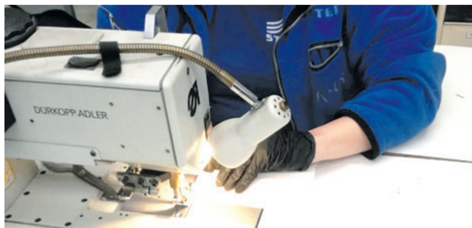
Wielkie szycie w Szamotułach