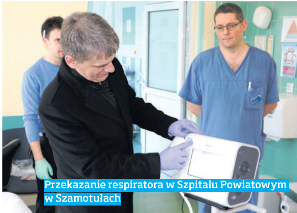
Przekazanie respiratora w Szpitalu Powiatowym w Szamotułach

Cieszę się, widząc wzajemną pomoc wśród mieszkańców. My także dokładamy swoją cegiełkę, wspierając szamotulski szpital w walce z niewidzialnym wrogiem.