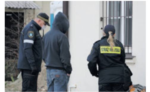
Strażnicy w akcji

Kilka dni wcześniej poprosiłem komendanta Macieja Grądkę o wyrażenie zgody na towarzyszenie szamotulskim strażnikom miejskim w czasie patrolu. Takiego normalnego, w którym strażnicy dozoru powierzony im teren, reagują na zgłoszenia mieszkańców, interweniują. Komendant, nie bez wahań i pouczenia o prawno-administracyjnych zasadach, dał się przekonać.