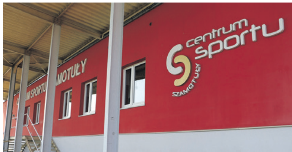
Wojewoda nakazał samorządom wyznaczyć na swoim terenie miejsca ewentualnej zbiorowej kwarantanny

Wykonano niezbędne prace, a pomieszczenia wyposażono w wymagany przez przepisy sprzęt. Pomieszczenia przystosowano do przyjęcia 10 osób. Gdyby zaistniała taka potrzeba, uruchomione mają być dodatkowe miejsca do kwarantanny.