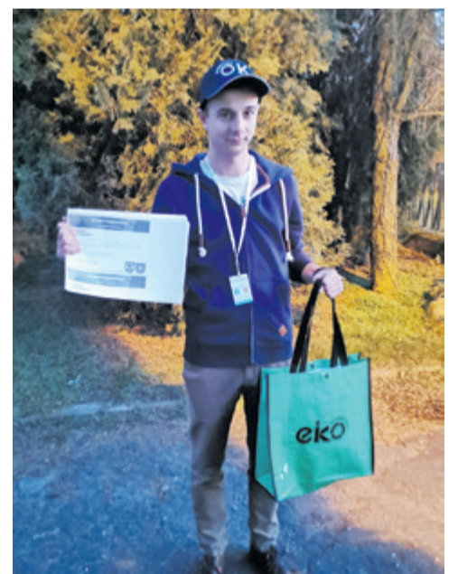
Wolontariusze mają identyfikator, czapkę i torbę z gminnym logo